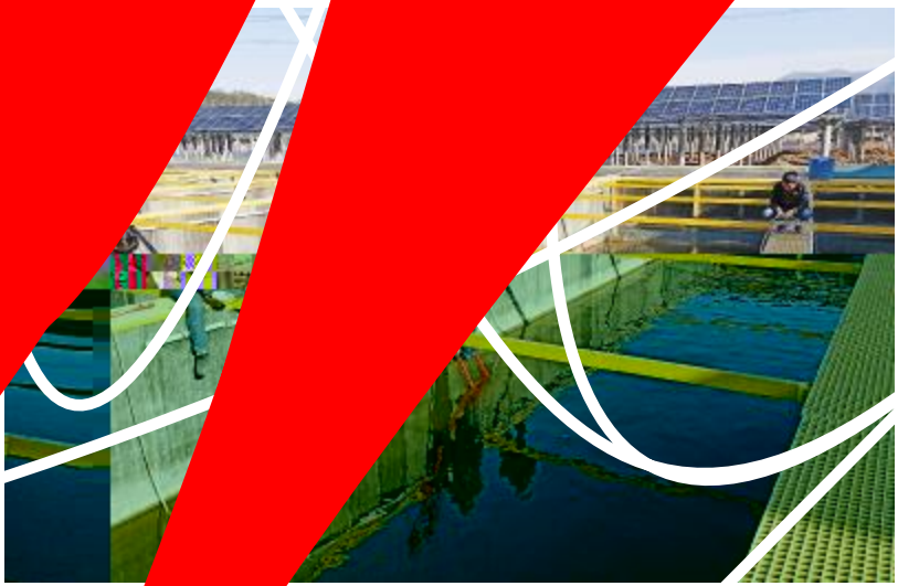
低水位固定式循环槽