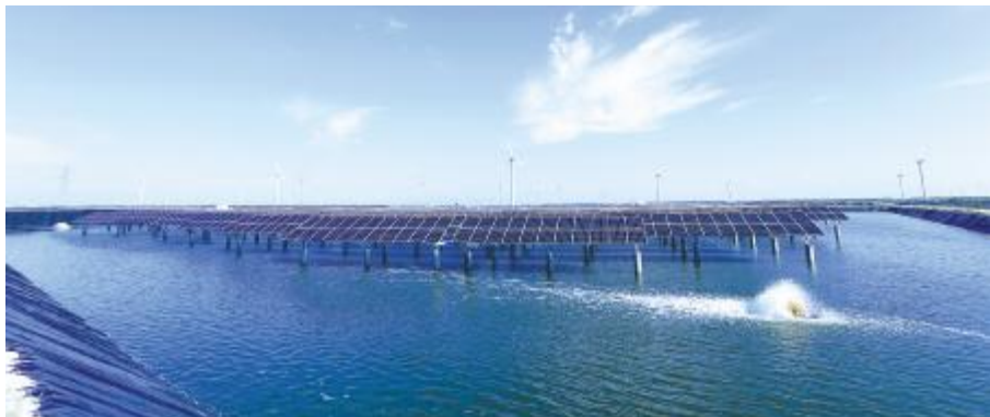
通威江苏如东“渔光一体”项目

9' %& n543 nv r3 % /q4 / ] /<` % 7xz X Q? \ ^ ] Z [ X ^ [ ?N o< / / < %5 ny<2019 5 ?9' %& [ ?8Y ^ / % ^ [ & / , NH8 NZ [ < B " 5` a 8, ] %O1bDV, < ?w?6N8 ? ; x: [ l 6! ?# $ % &' MNO 2019 878 ? ( 9t 9 n ^ ? nto-. / O1) . } \ 238 O>?nZ [ q@Ar? btC< +) * ?u616CDgV 23? , - ? c89 n < 6G 20.76GW<9' 9l 5] ^ / n 2019 4! ?9' (gO17 ) / 7xz [ 898 efvw 9 Q^_Z [ mB <9l | ] N $ x? t 9 n ^ : ?9l Wu n l Z [ l yR $ bTR ?j 8b8?n OtNr 23 2018 @ X ^ : ? i z c n : { ? 3X O . . n ? 2020 j y? O n 3X ? 6% z c O O1 . t n OYJ } \ ? 6% z c n Ot 845 n $ . . n < 3? 83 NrO123 ' ; < pq8 } \ 3: <