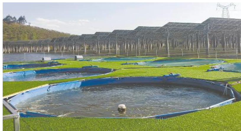
路基圆形槽养殖生态环保