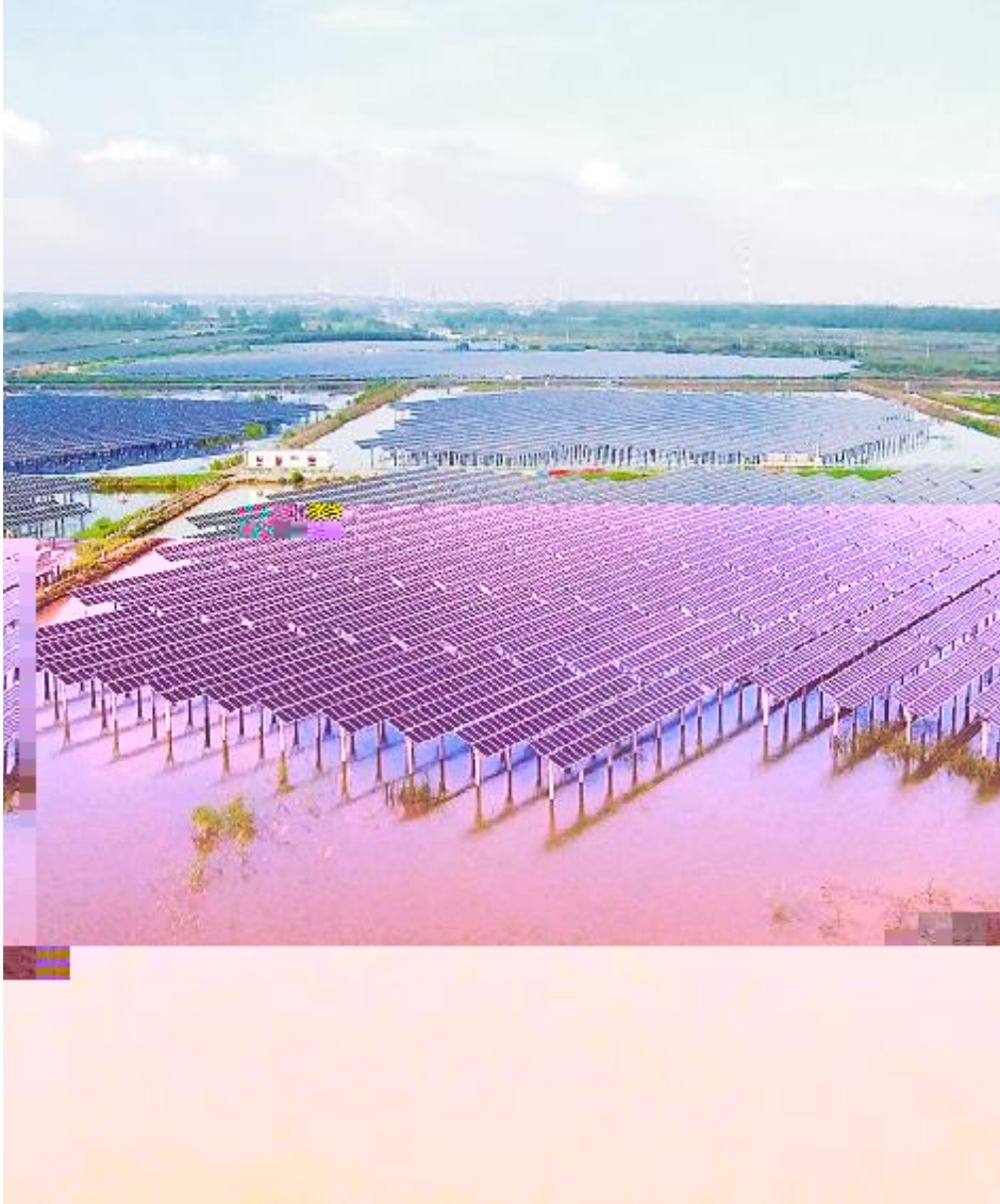
通威龙袍“蟹光一体”项目

2019} 6S19TJ' n - O/OU1 POB PQ ghmO" >QRSTU 4 WtXZ JJY e fdPW Z[\B^P^ _> `J'n /6, | 9abF ZDcde rsBn fiefrs *g M' nhi "jkl - O/OU1 H { WJ 'n- O/OU1ghk lM { m/OZ! - O/OU1QRST Wn zo p KRBCd1 $J; Rz9 bqm rq} sUJ s O t 1 guJn q CP f> B bgh Mvw - O/OU1 PQb g hkl 1O1Z