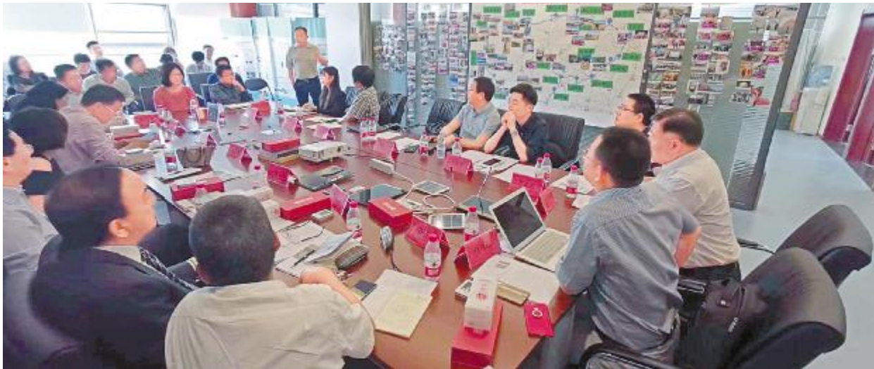
光伏“# $%&' ( ) * + 会现场