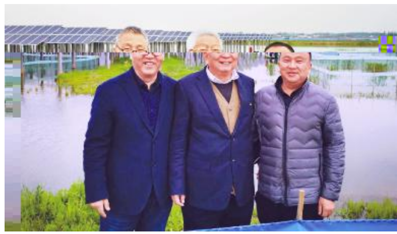
通威股份BC水产DE吴FG" 7889: ; <=>?@N/O现场PQ

河蟹早中期的O养需求特点 l 3 - *\ d. pq8tC3 ?* \TU 6 mp; ?\ l c 8*\m?} MbvO] c3RMB&Jhp F*\TU l - 8%O { &, \} ^ NO?V