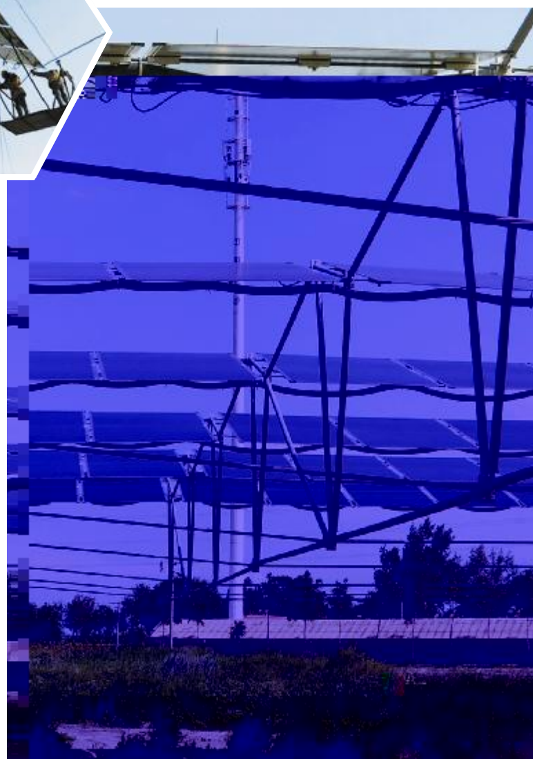
柔性支架 V 型索系结构