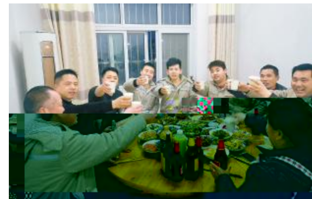
泗洪 t E K E