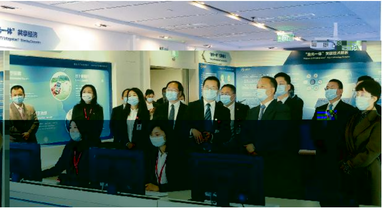
DEFGHI JKLMNOPQ#RSTUV7WXYZW: [ \

. / 01 23456789: ; . / < = > ? @ABC < DE FGCHI