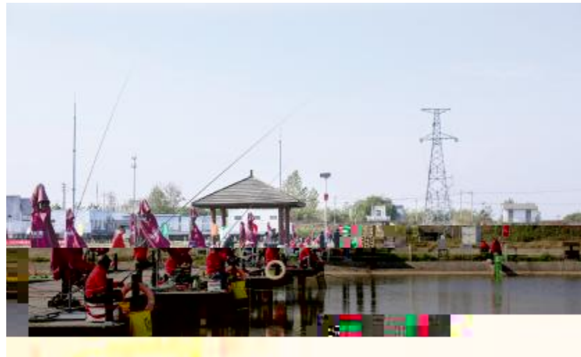
2020 F $5 RS $5 RSTU 举

品组成立以来,深入贯彻力,为公司发展致聚质量人 主指和邱, , 资源。 制定, 基打、化、为坚决贯彻执一体化、化、 产等作落。通新能源合基化、化的目管基则和 品组经介绍。前,品组核管思路,将通一体基 相关作主绕助共赢、打独具打为、为一的人 特色的一体品个展。场所,一能基管 助共赢,利用基展人,实一基员D是品 得收益,基强对},是、资产管 指"和=、基实从},通新能源强化执,将执 共赢。"通过打独具特色的化管一步,立通 一体品,形成品效,助力多通,定和质、 产品走,赢得市场。和断质量。在邱的带,各基将 对趋烈的市场,通新化资源,力化,落 能源在打基的,一实6发展观,实6管,'基 步强管,展能,管走规化、法制化、精益化。 基人员合质,实基,各基将强化化管,将相 实力。根据公司发展规,基员的管法、管模式管经 一、能,通过管相合以有效用,用 ,基人员具的管思和"员,有效 能,形成一体独有的生产基员执力,从而一步