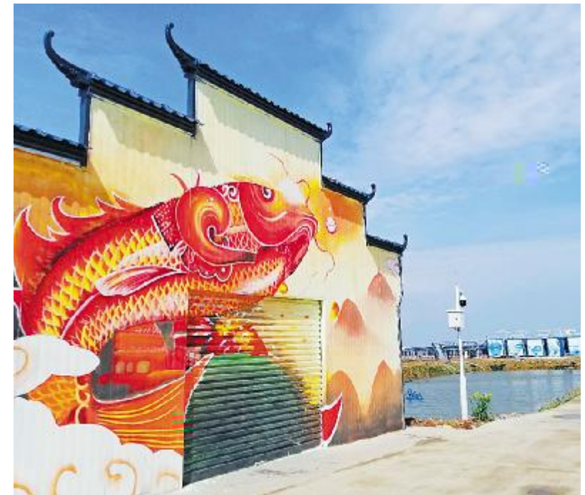
$5 泗洪 RSTU T