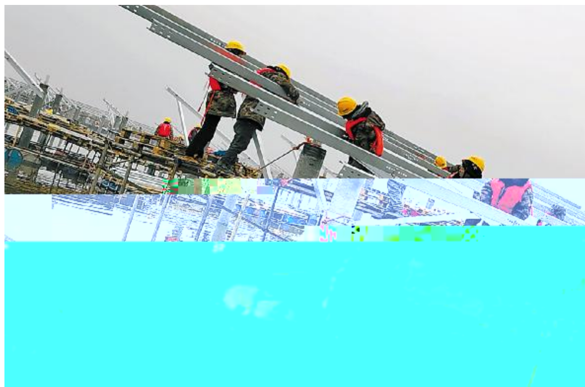
$5 RSTU 项目施H

一 体 电 安 全 生 产 1880 多 天 的 , 有 人 默 默 坚 守 。 为 这 r 坚 守 , 他 已 经 缺 了 太 多 人 的 夜 夜 。 晨 曦 曙 露 , 岁 末 春 , 他 一 奔 在 巡 、 保 证 安 全 生 产 的 路 上 。 为 保 障 春 各 的 安 全 生 产 作 , 中 前 安 排 署 , 各 作 步 。 春 前 夕 , 2 7 , 安 全 师 中 近 300 员 展 春 安 全 = , 对 假 在 的 主 安 全 隐 患 对 L 施 了 = , 安 全 , 安 全 、 掌 握 一 定 的 安 全 能 。 在 各 电 , 扫 $ 紧 张 有 c 中 , 年 、 贴 春 、 精 排 春 祝 福 , 年 味 儿 来 。 ! 简 单 的 年 夜 ” , 带 着 对 # 年 新 发 展 的 $ % , 这 人 将 奔 赴 各 的 。 年 初 一 , # 年 第 一 天 也 从 & 的 作 。 湖 7 公 安 电 人 员 这 天 一 早 就 对 ' 施 ( ) 电 , 为 公 司 成 展 人 机 巡 作 , 保 发 问 题 , 。 各 电 春 , 作 有 c 展 : 早 会 , * 得 比 年 有 精 气 神 + 式 上 着 , , 的 , 中 多 了 r 的 待 湖 巡 缺 , 一 如 口 往 的 - 待 政 慰 问 , 的 。 2 20 , 随 着 中 春 安 全 = 会 的 , 新 一 年 的 安 全 作 已 经 / c 幕 。 2021 , 而 , 全 力 以 赴 保 障 安 全 生 产