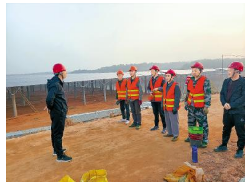
项目召开I 业前 会