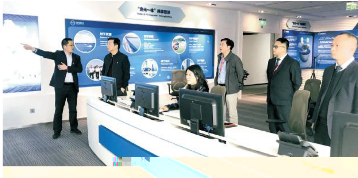
$56789: ; < = > ? @ ABC RSTUV7W YZ & H

uv < E3 B] 3 T这 6 为 - BY ' ? 3始& (I g - V f \ 8 $6sW Kf • = 3 往 6 + F 3uvB到 3 A - • 生 BY 6 Vu v 间 3 [ $ % Y 3 3 为 * • 生 KL3 r , - + . ! r & 3 L# 为 生活4美 WB企 愿景V z 3 @A把 这些 B V 6个uv B o 6个 - B V ' ( ) * + $ % & / O 陈婷