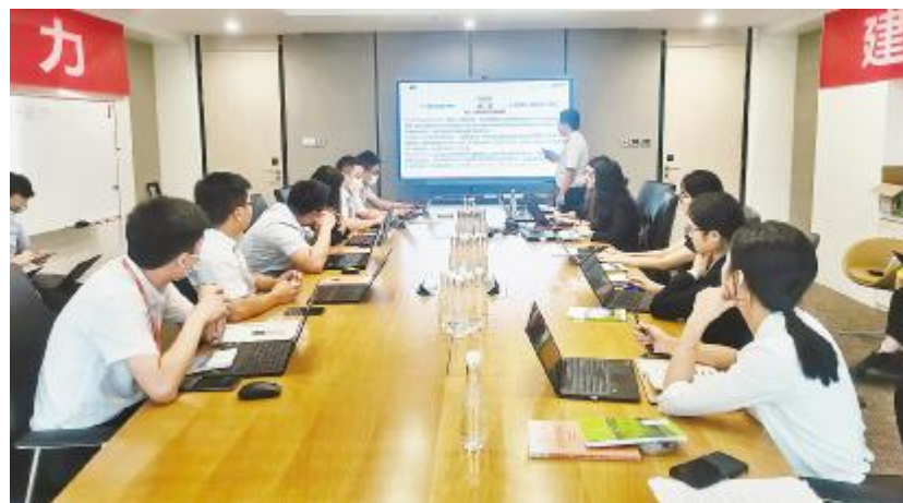
通威新能源举行产品生命周期培训会