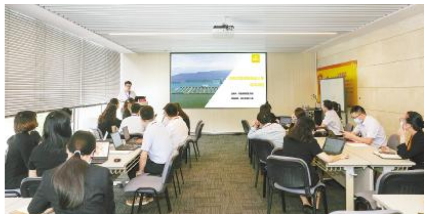
项目开发财务测算模型培训会现场

! " # $ % & ' ( ) * + , - 8 11! "#$%&'()*+ , - ./0123456789: ; 23 <#&'=>?@A()*+B CDEF"GHI J AKLDMNOP QR"%&' SATU&AVWK- Y Z[\ 140] ^`_` aW bcde fg23"#&' h8i j kSl Cmnopq23rstuRv9 234a"mSw()*+BCc xyz8{|}9~先"mS指p为什 么要设立()*+BCD? s为一个商 XQ体"需要有产品W客户和销售渠道" 需要有市场营销AV9()*+BCD c5立弥补{ %&' 公司SA长期没 有市场营销AVc 缺陷9 其: "mS指p如何抓好()*+ BC? 一是要建立()*+BC系统9 ()*+BC千F万绪" 需要统筹梳 C" r实现()*+BC信息平台化" 用现代化c BC系统指挥s战"不&用 "游击Z"c思@z8()*+BC9 二是要2养一支高素质c()*+BC Z伍9我们已! D织编写《()*+手 册》" 该手册应该5为全体u工学习c 教材"()*+BCD将依据该手册* +23 " * + " 有* + ^u要! J " a " . ()*+Z伍c素质不 . 高9 是要抓 ()*+BCc 个 . 9( ) * +c. 质是J. . c. 5" () . . " 需J. 手. . . 是一 c": "我们要. L' . . . . . () c * +a. " ^W W . . . . . () . 9%&' . . . . . 一体 . . . . . . 为不 . . . . . c. 缺L ' " . 一个 . . 一个" : () * +要 " . . . . . L' . . . . . 9 23 "MNOP . . . . . /O 1 c 5W . . . . . /O1实 用 M " { , . . . . . /O1c . 代W, . . . . . /O1D5A "rS { , . . . . . /O1 c O要 素9 , . . . . . /O1 用 "MNOP_实 ()为 "现场为 . {!" #据. /O1c$体 . 用M%"r & . ' ( { #据)写* + c, - j ("r w. . . pc. z 8{ /O9 #* : ; 23"z-1. 高{ f 3 ^uw() * +, - . / . 要2和 用. /工$3要2c 459. 66 "7 工s "将统一思8"JC? 用 !" 工$"为() 9>. : ; 实有<c j 实支=9