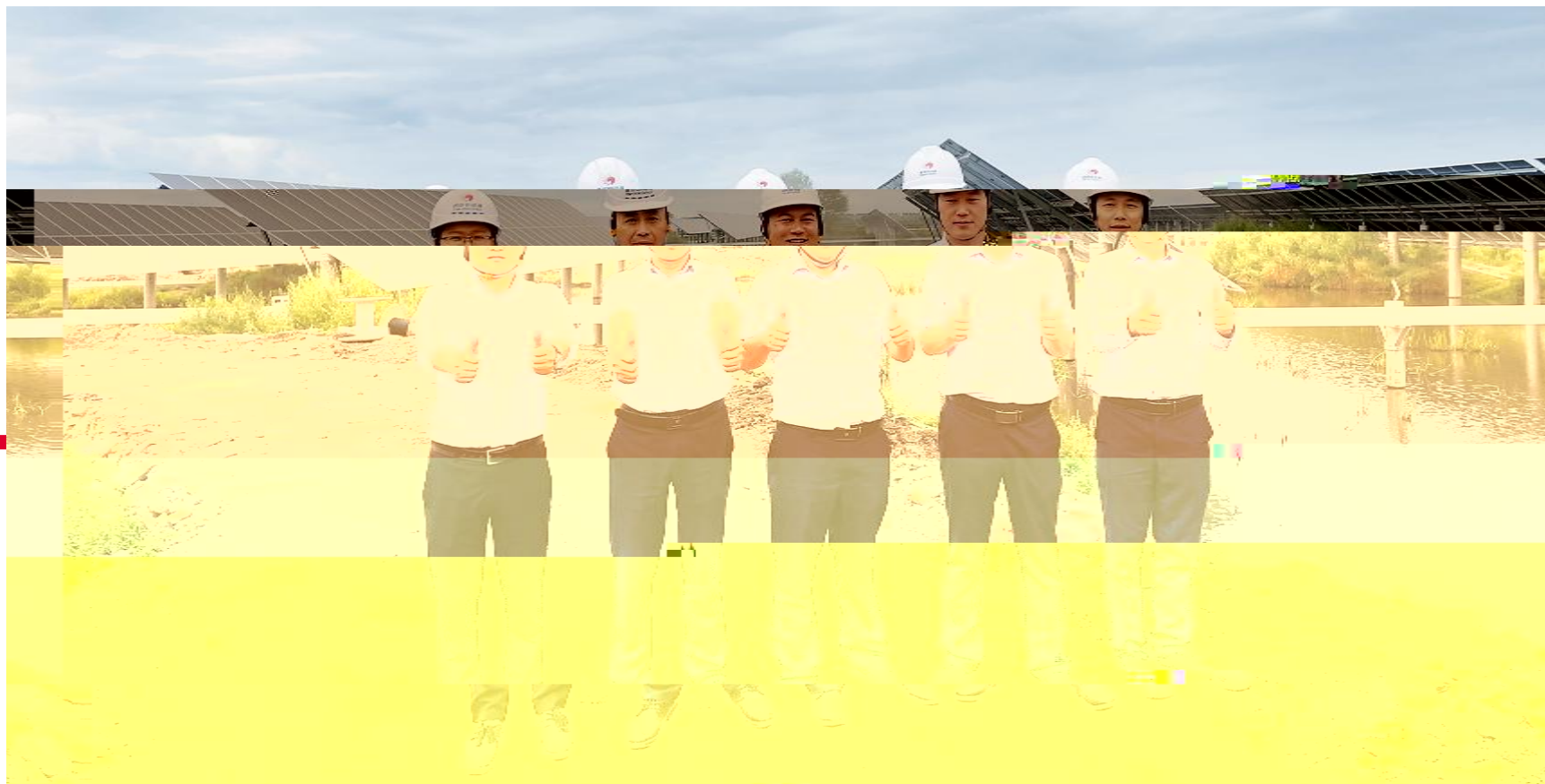
北京新能源绥化项目团队合影