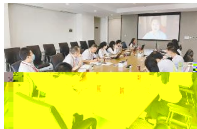
业务二部员工线上参加演讲比赛