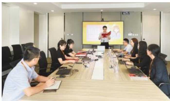
北京新能源演讲比赛现场