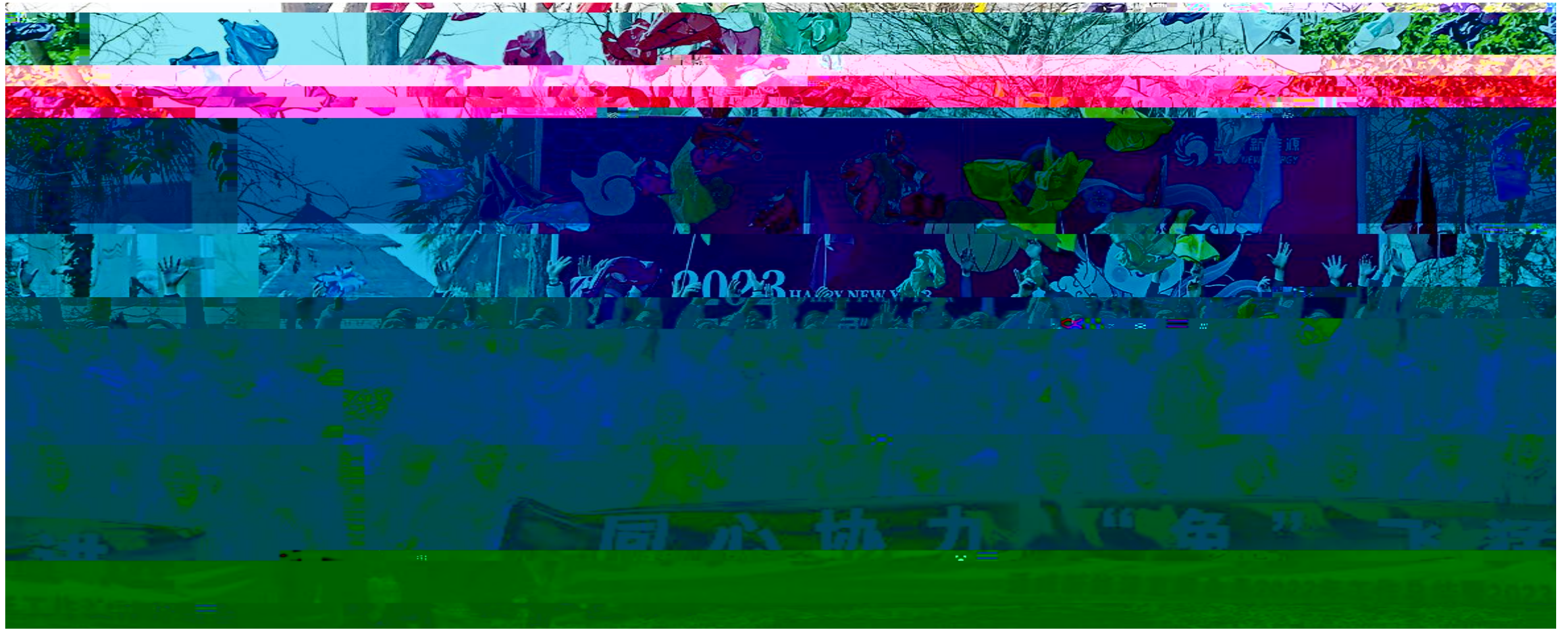
通威新能源直属业务举行“同心协力‘兔’飞猛进”团建活动