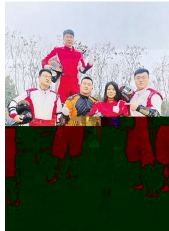
我们的团队有力量