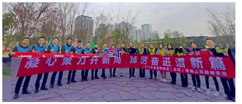
通威新能源深圳公司团建活动合影留念