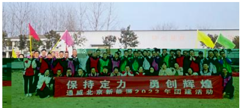
通威新能源北京公司团建活动合影留念