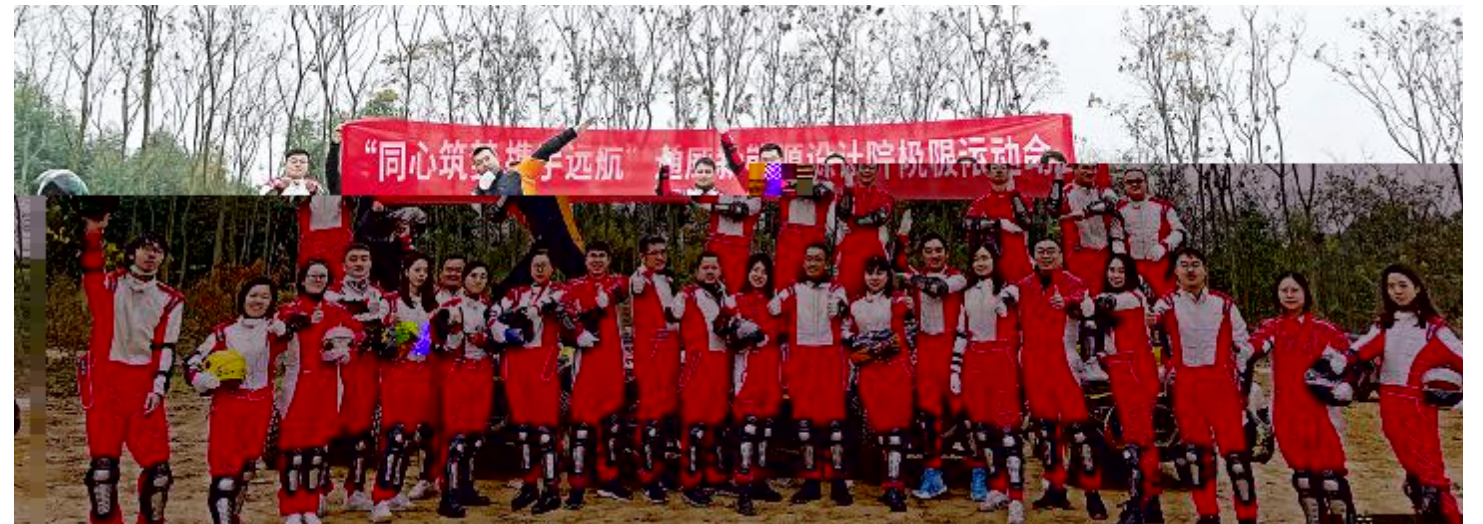
通威新能源工程设计公司举行团建活动