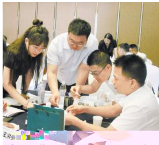
《结构化思考与表达》专项培训

! " # $ % & ' ( ) * + , - . / 0 1 2 3 4 5 ! 6 7 - 8 9 : ; < = > ? @ A B C D E F G H I J K L M N O P Q R S T U V W X Y Z [ \ ] ^ _ ` a b c d e f g h i j k l m n o p q r - s t ` a u v w x P \ y z { [ | m } ~ ! | m 因补短板抓效益冲 B 锐意取 负韶华 ` a u v 业 c 听取 后 吴 e n 容 评