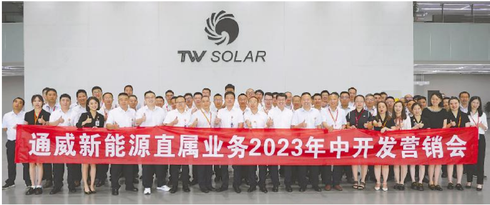
#WXYZ" [ >| \ ] 2023 ^O] _4` S