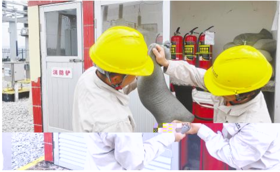
! " # $ % & ' ( ) * + )