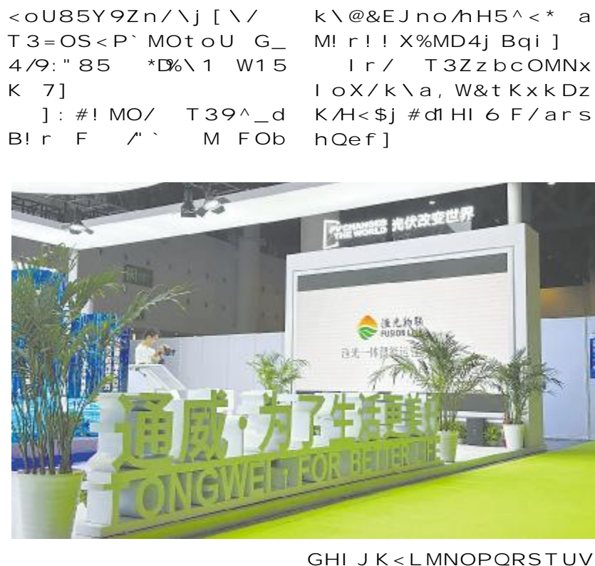
GHI JK < LMNOPQRST UV

EF % ( 通讯员 李昕晟) 6 29 -7 3 / =1 < $ % v, _ % H4HR- MV9 < $ _ % h 49G RO] T3rHa g D #K q F! m" # $ o] ^ 44 5a /o B% 20 (&' /56 ($1j &) / $] 27 ( * i) Dkj % + % & z K, - D * [ 2i ( ' i . km3500 / 1Ot $ o/ROyt * GD! 2! r D W3f sA 50 / 4] T3rH85* ^ % 76M7 8 % " 9: Ot /; O=r /Ja, < = qw>? / @A #K q FBC/Dz 7t WD qWD#KWM OtEuF /G. HI F/uuOJ KLMNOPqu/QqMNI r ] 7 12 /V8 <R 4G o] S] $oOt PTO$# %V VD%9: D%W /H#$ < _& ) RyMNxI & tno!! %MoX/ %MDY] T3/ \oUMN$% - M7t ( ) / . / & toO9: j n