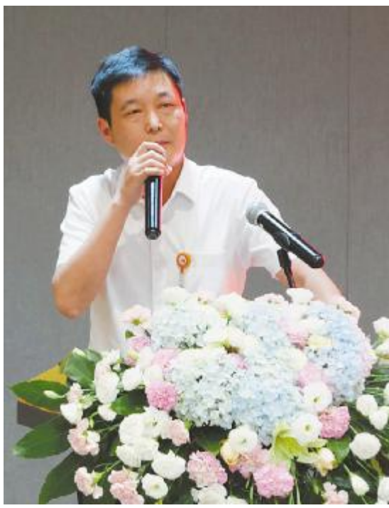
#WXYZi! j k37l mnop

号角吹响，奔向同一个目标。因势而谋，才能谋定后动；顺势而为，才能有效作为。下半年已开启，怀着只争朝夕的紧迫感，奋力冲刺全年目标任务。真抓实干，切实提升执行力。最有效的真抓实干，就是要昂扬“拿下山头”的精气神，强化责任感、提高执行力，突出“快、大、强”，持续“争、! ”，“力”#、$、千”，%—&'（千、实干、）于*下真+，，- . 的# /、千/、 /O123出4,5动“67-8”实9: 高; <3=。