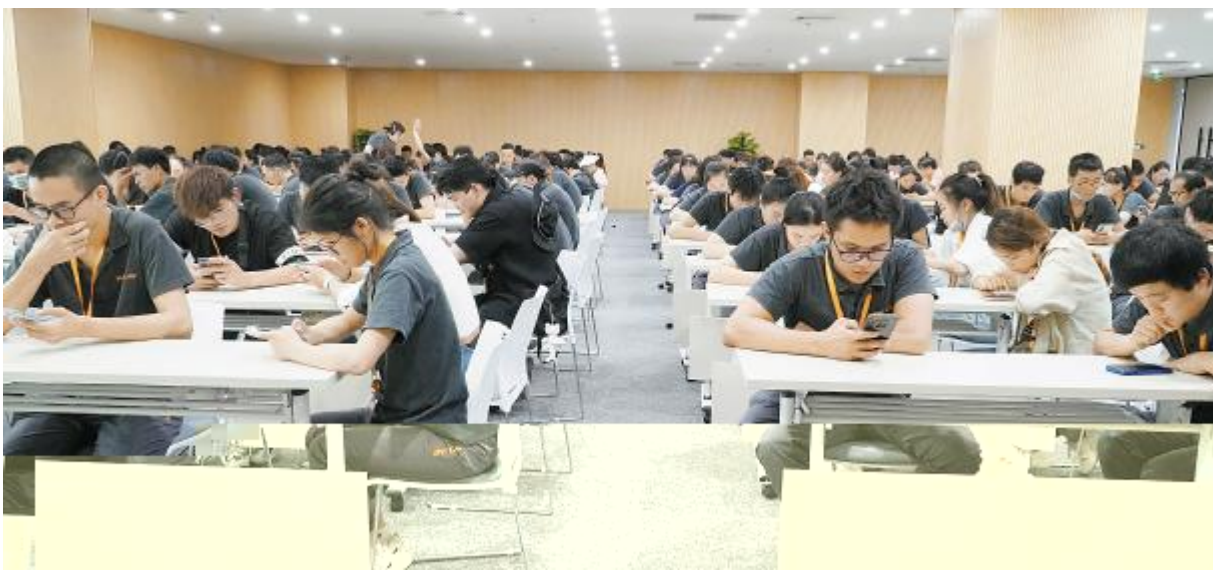
2023年年中员工综合技能等级评定,组件盐城基地考试现场

! " # $ % & ' ( ) * + , - . / 0 1 2 3 4 5 6 7 8 9 : ; < = > ? @ A B C D E F G H I J K L M N O P Q R S T U V W X Y Z