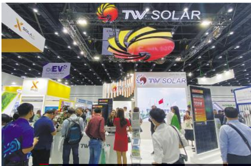
通 技 西 钟 继 议 施 效

8! "#$%&'()*+MN 磅亮 " 吸引 众m客商驻 解8 参加 2023 世界%&' VY 业博览 7为今 首 前沿 品——TWM- 泰国曼谷%&' VY 展览 巴西 ND-72H(Nth片 182-72版t 单玻 圣 罗%&' VY 展览 全球VY ) * + " 兼具 输出R 收 回报" 展 "展示# $ ) * " I 享# $ 创 广泛适f I 布式KZR工商业屋顶 新 R 服务E 案"让国际市Q f Q 景 8 Q 还 展 出 解# $ 智 R 创新实L "拓展国际 TWMPF-66HD (Pth片 210-66 版 市Q8 t 双玻) * + TWMND-54H(Nth 片 182-54 版t 全黑) * + 八 市Q 业博览 F 广州举 " # $ 携 主 品"拥 K K ) * 为全Q景 j 解决E 案8此次展 O 本 超 衰 J 续稳定输出 势8 聚集 1056 家展商" 展览 60000 # $ ) * 展台还\置 = 系 { E 米" 吸引超 100 > 国家3专业观 趣3游戏W R 抽奖 " 参展观众# 众前 参观" 国内 h dq3V 拍照打卡 活 " = 步 解# Y 业盛事87为全VY 业3 $ VY 业3 展8 要参, 者R推 者" # $ 携 ) * 携手c心" 辍8展 Q"# 明星 品参展8 $ % & ' ( ) * + 还, 广东奥飞新' 源 展 Q# $ P t N t 主 展品 限公司 广州 西冕让广际