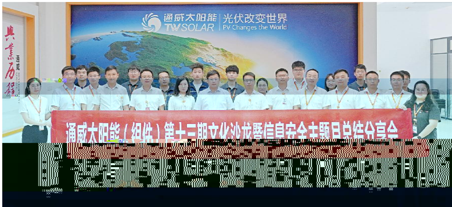
通威太阳能(组件)举行第十三期文化沙龙暨信息安全主题月总结分享会