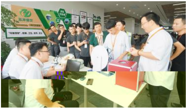
组件盐城基地线下答题抽奖活动现场

[ # \ ] W R S ^ _ # + ` 1400 a W R S t H I J K L M O N O P Q R b W R c G Q d e f g h S ^ _ Z [ i # j W R k l j m X Y ! " n o p q O r r = s # t u v w n S x y g h z { | t } S ~ U H 1 2 3 4 5 6 7 8 9 : ; < = > ? @ A B C D E F G H I J K L M N O P Q R S T U V W X Y Z