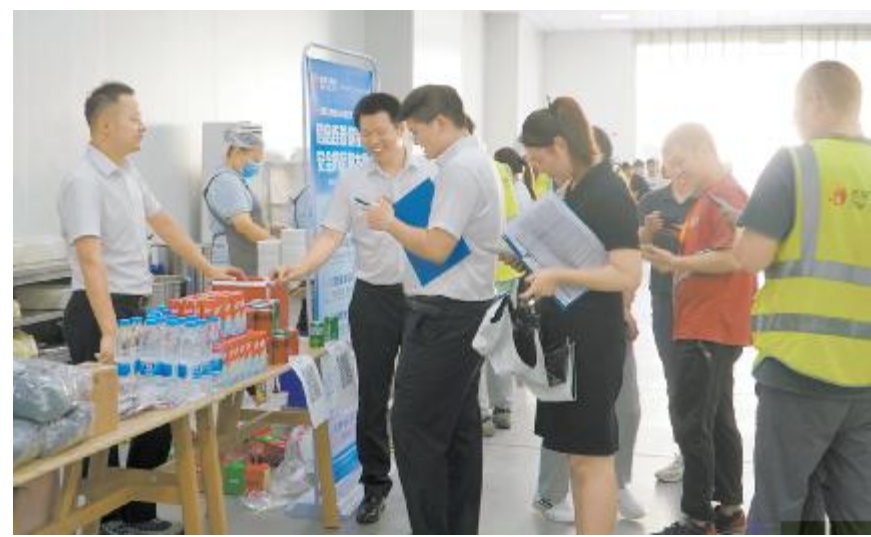
组件金堂基地线下答题抽奖活动现场

[ # \ ] W R S ^ _ # + ` 1400 a W R S t H I J K L M O N O P Q R b W R c G Q d e f g h S ^ _ Z [ i # j W R k l j m X Y ! " n o p q O r r = s # t u v w n S x y g h z { | t } S ~ U H 1 2 3 4 5 6 7 8 9 : ; < = > ? @ A B C D E F G H I J K L M N O P Q R S T U V W X Y Z