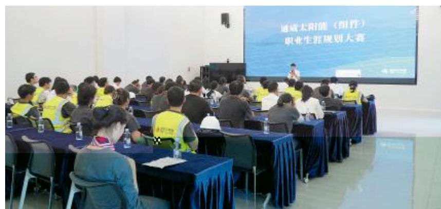
职业生涯规划大赛组件金堂基地比赛现场

./0123 456789: ; 8- : ! " # $ % & ' ( ) * + , - . / O 8 G 12 : ; < = > ? @ A B C D E F G H I J K L M N O P Q R S T U V W X Y Z