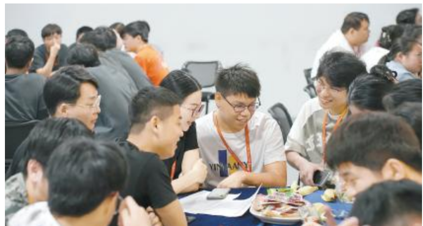
启航员工互动交流

! " # $ % & ' ( ) * + , - . / 0 1 2 3 4 5 6 7 8 9 : ; < = > ? @ A B C D E F G H I J K L M N O P Q R S T U V W X Y Z