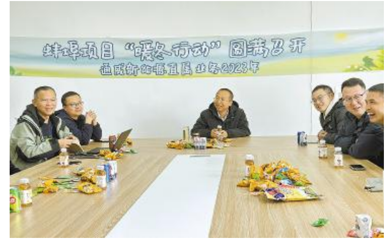
茶话会倾听一线心声

! " # $ % & ' ( ) * + , - . / 0 1 2 3 4 5 6 7 8 9 : ; < = > ? @ A B C D E F G H I J K L M N O P Q R S T U V W X Y Z [ \ ] ^ _ ` a b c d e f g h i j k l m n o p q r s t u v w x y z { | } ~ ¡ ¢ £ ¤ ¥ ¦ § ¨ © ª « ¬ ® ¯ ° ± ² ³ ´ µ ¶ · ¸ ¹ º » ¼ ½ ¾