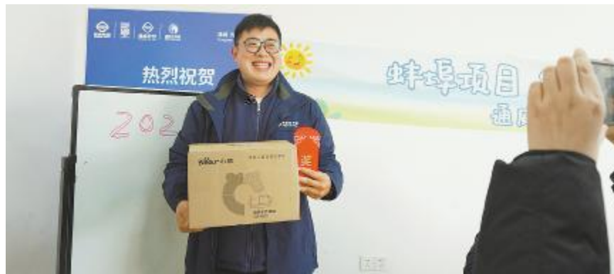
为一线员工送去冬日温暖

进一步了施工和施工，保和设的供应，了和的，开冬季施工全员全，以提工建设人员的全和作。丰二期项目部在攻难题、抢抓工期的时，多施保项目全，并项目。期进大，对，的题，坚持改的，能改的题决，对一时难以改的题，设期！“# $ %。时，项目部用“&”、“（单”推进的，进一）*全+。通持，工作保-施，$ % / 度，保部、工人员充O、1、2严格，34工全5，提6团队，全力提施工全标7，为打造品工提供坚%保-。项目部继，8持9：；< = > ? @，全力以A推动丰南二期项目成为BC范，为通威新能源DB的提供E力F持。2023年12月，通威丰南“G9-H”二期项目I J K单L并网成功。项目建设，面对挑战，全H工作人员M难N上，攻攻坚，OP山Q，推动项目R并网。