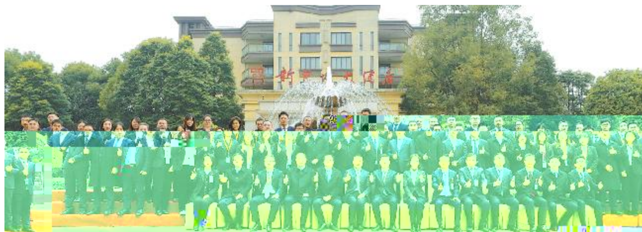
通威新能源召开 2023 年度工作总结暨 2024 年度工作计划会

- V ! ` a bc` a d ef ghijkl ! m Z " # % # n opq r s9 $ Utu ! vw 7 xy 6 z { N | } ~ b " t 2 Q gh 6b b z 2024 ghj ! w q d & j % ! ` a & & p gh & 6 [ ; < 3 J X =