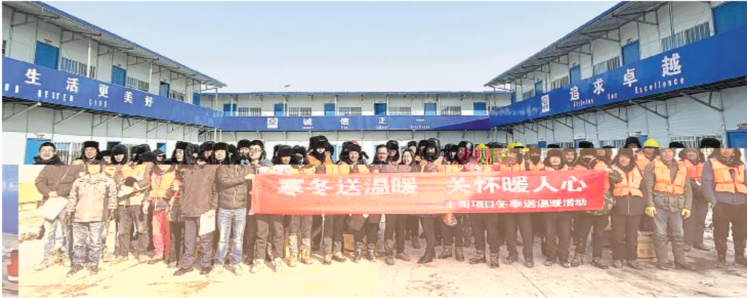
通威新能源北京公司开展“冬送温暖暖人心，凝心聚力鼓干劲”寒冬送温暖活动