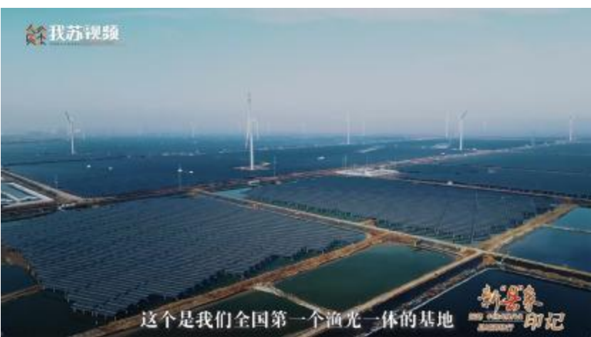
媒体聚焦通威如东“渔光一体”基地

通威“一业一最”，了能源“、保丰。“能源，下安全，“一“能源“国者中了的，为，了“通威，多源地区的，并的。记者钟继辉