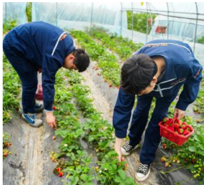
采摘草莓, 享惬意生活