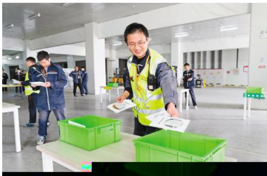
通威太阳能科技固废分类竞赛活动合肥基地现场