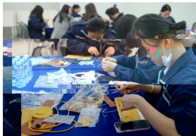
金堂基地开展妇女节手工制作活动