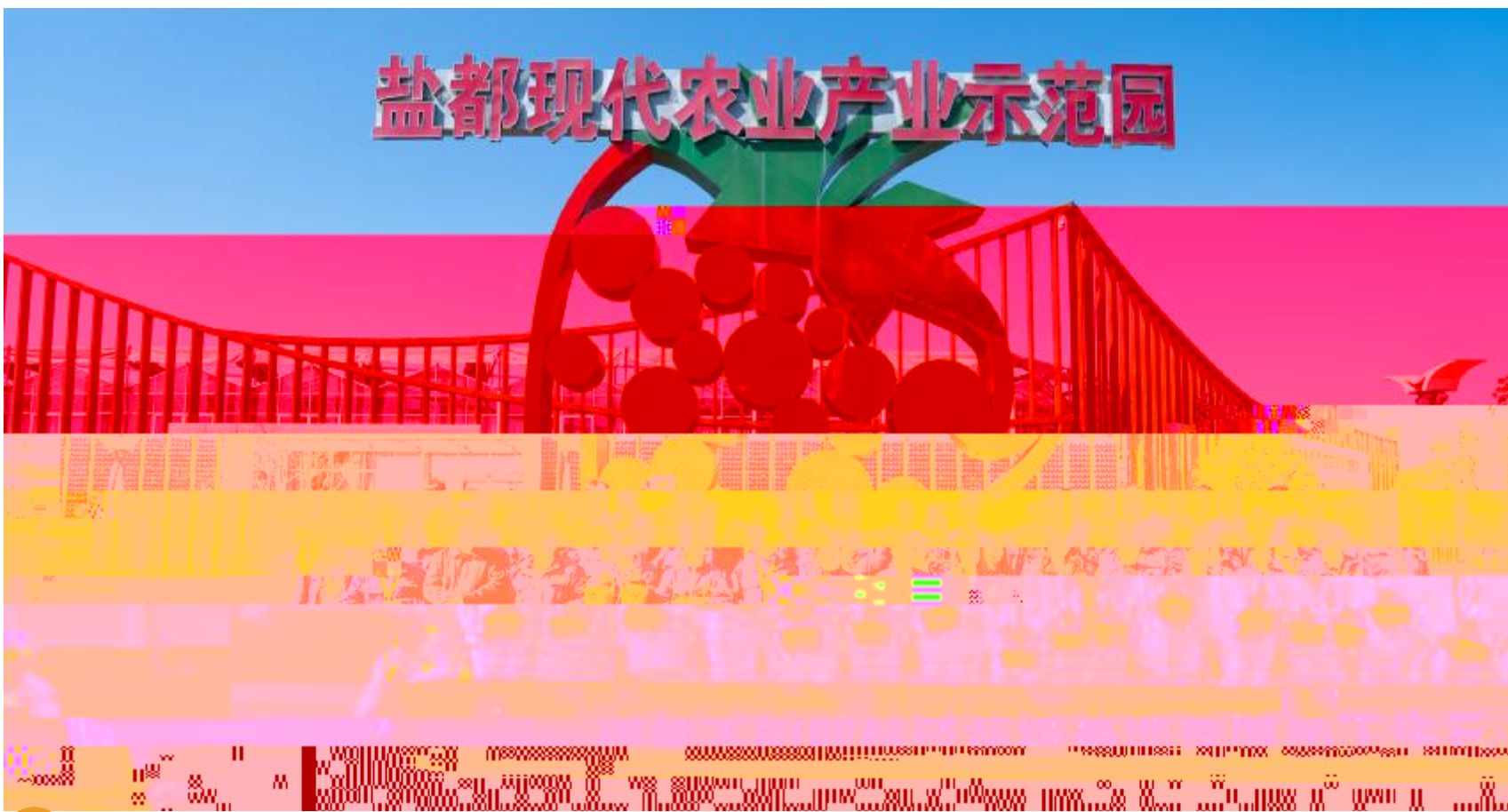
通威太阳能科技一季度员工生日会盐城基地合影留念