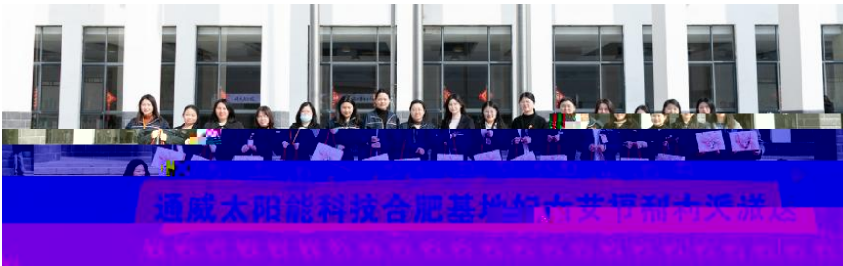
通威太阳能科技妇女节主题活动合肥基地合影留念