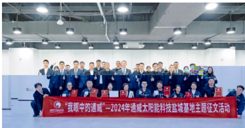
盐城基地“我眼中的通威”主题征文活动决赛合影留念

3 20! A6! "#$$) s%&` aAeARS. k#Tw L/O12k34+Ob! 5: 6rb! 5"7>TwL/+O!, 989: ; <3: R== S">>ka?b! @"ABb! CD". /O1Eb<" FG"H I J. KL: MN<3O^">>PQ5. RwSaTUAVaWUO, ; "kX: ; YZ" [\A] ^"kX_` a>Yb" ccbd: 5 2efgu"j f=hi j kk"l GmnaopEkq" rv: >>ss@t"uv" wdx"y>>z_{ |E} ~"ke5" 守O1岗位"尽职尽责A保质保量完9各oO1: #$$) s%&k 直致致力于打造{ 馨AE 谐" O1 环境"注7 +O" 9长与福利: 未| "uvO5也将持续创Yw杯模5"丰富* +<3形5"与+O共? Aq. /"助推uve 质量t 1: