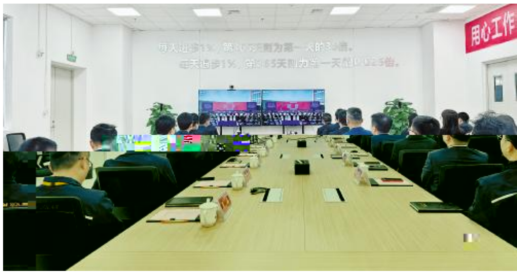
通威太阳能科技南通基地收看集团企业文化启动仪式视频直播

刘汉元主席指出，通威自己独有的企业文化，完完全全立足于以前走过的路、做过的事，并在此基础上的梳理和总结，而不是从别人那里拿来套在我们身上的一件“外衣”。