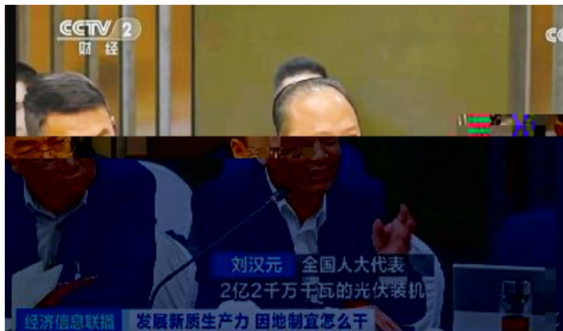
全国人大代表、全国工商联副主席、通威集团董事局刘汉元主席发言

刘汉元主席在两会期间，就光伏行业高质量发展提出多项建议。他建议，要进一步完善光伏行业政策体系，加大财政支持力度，优化光伏项目审批流程，支持民营企业公平参与光伏电站投资，推动光伏产业绿色转型和高质量发展。