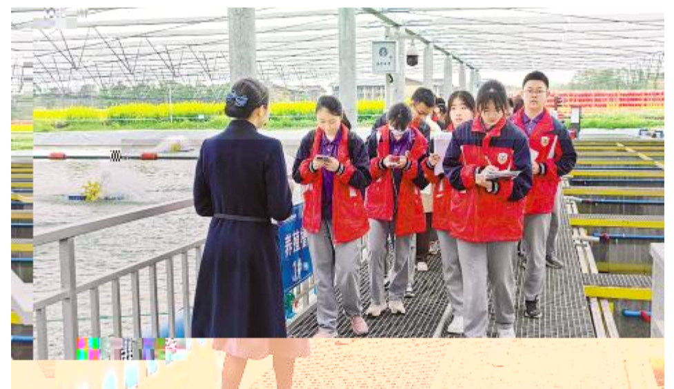
成都实验外国语学校研学之旅走进通威渔光示范园