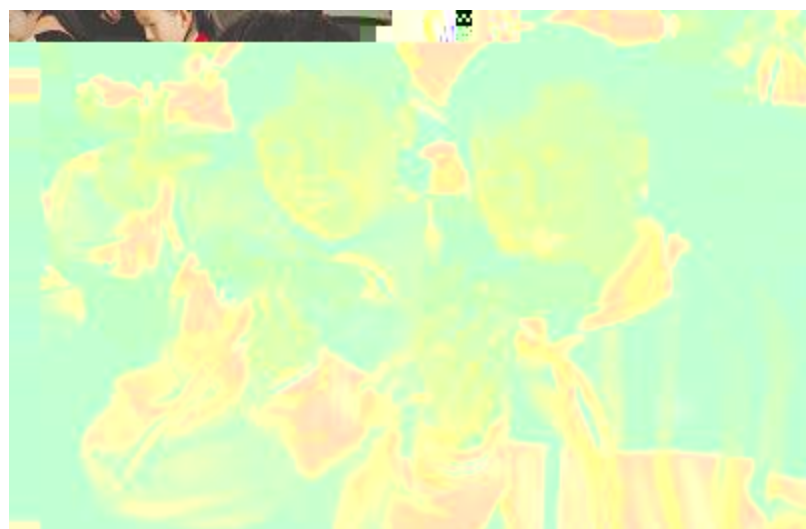
同学们展示做好的太阳能小汽车