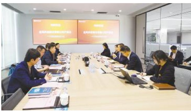
金风科技莅临通威新能源交流

座谈会上，各方就光伏行业现状、发展趋势、合作机遇等进行了深入交流。通威集团表示，将充分发挥自身技术优势，与各方合作，推动光伏行业高质量发展。