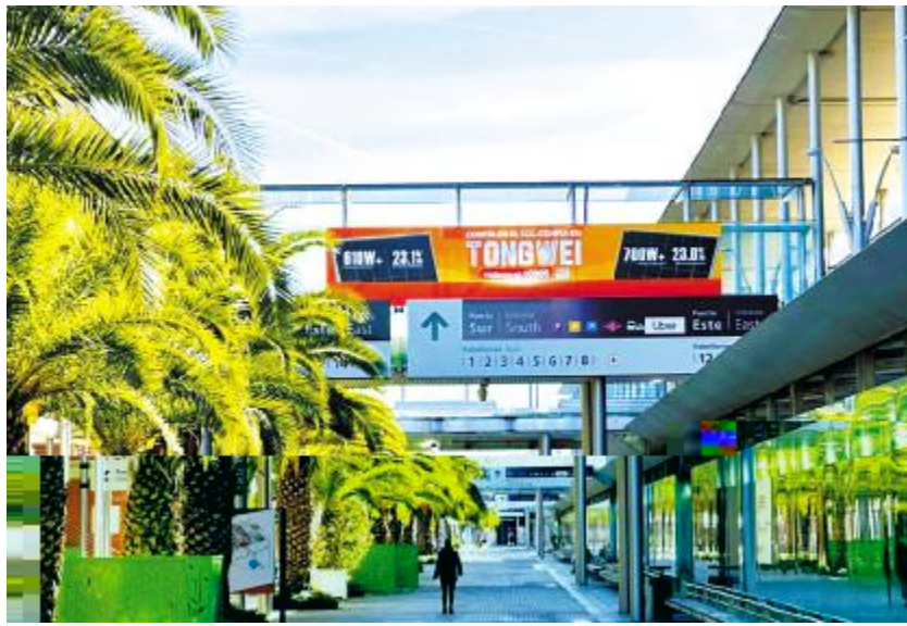
通威“智造”亮相西班牙马德里各大主要交通枢纽