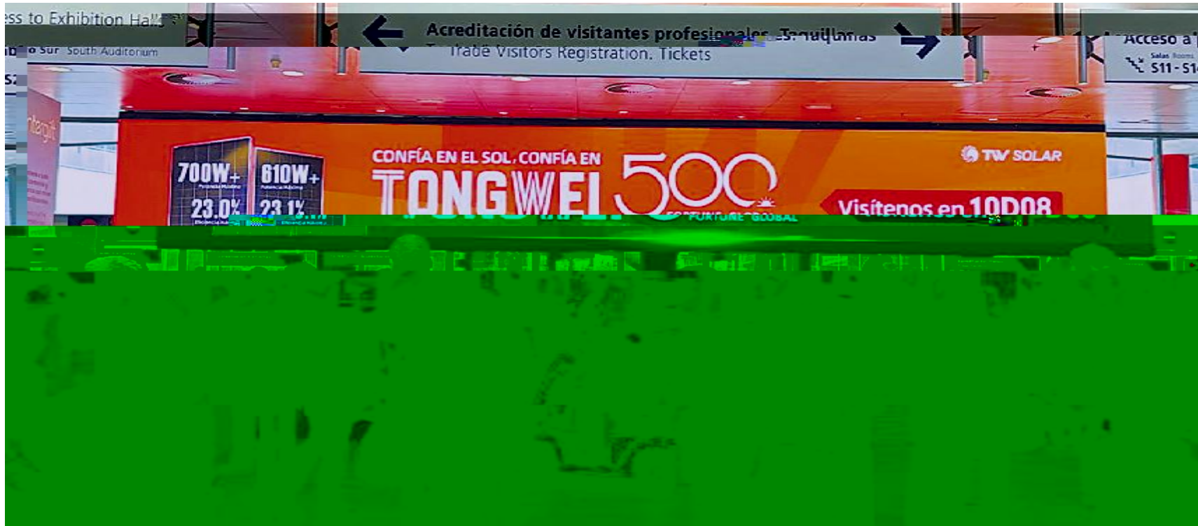
通威“智造”亮相西班牙马德里各大主要交通枢纽