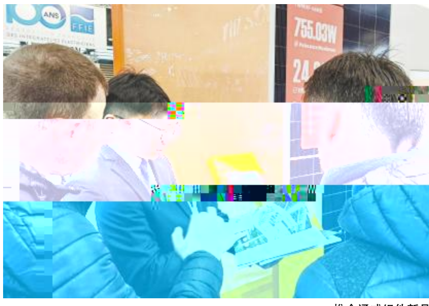
推介通威组件新品

! . / ( Memodo O1 23456 !"#$%&'()*+,-. /%&O1 234 256 ( 789: ; <=>?@ A BCDEFGH IJKLMNO PQRSTUVWXYZ XYZ [ 2! "\ ] O1>^_QR` =abcdefg hijkl MNSTUVW m%&nopqrs 2 uvwPO1 234 256( 789: <=>xy. ztD{ } ~ ! " #. $Ss%&' 7() * ^Wgh , -H4. /OI.t ^1 234" 5627897@7: ; <@W !"H=>I.?@ABC~ DE PF$W " DGHpqh~ $SI J*^ . D! " O1KLPHMNI@ O.APQ26RPZt vw(ST> QRFUVWXW! " QRY} Z [ . \ ] ^ _ ` $a~ DEWDbcd2 efghdF$) O. z{ Qi j 2 FI ^hd2mnopqrs 2) Ot : ] ^2t$) vw2/ t~ *^ Y5x#yz} Zt: \ ] ^hj .D BVP) OZ[ yzQR$) vw.h ~ 6{ $S| yZ [ W ! " \ ] O1>^_QR` =a bcdefl } .~ b 4/ !" P( # $ % & ' ( ) * P + g , : . - . % & / O ~ $ S! " H = > I F $. 1 J D! " 23D hk l P \ 4 ~ P b # r 5. 6 % 7 8 9 : ; + P < { W ' X Y Z [ ] ^ _ ` $ a ~ I , = / O ) > ? S @ Z A _ U B PKCD. | E i F / ! " ( ) ) q , + g , : . - G \ % & 1 2 u 7 H! " F $ W! { . i j G 6 A J # U g . % & / O K L u! " H M I P N O P Q W n R . ! " / 9 S M N O + g U V W I