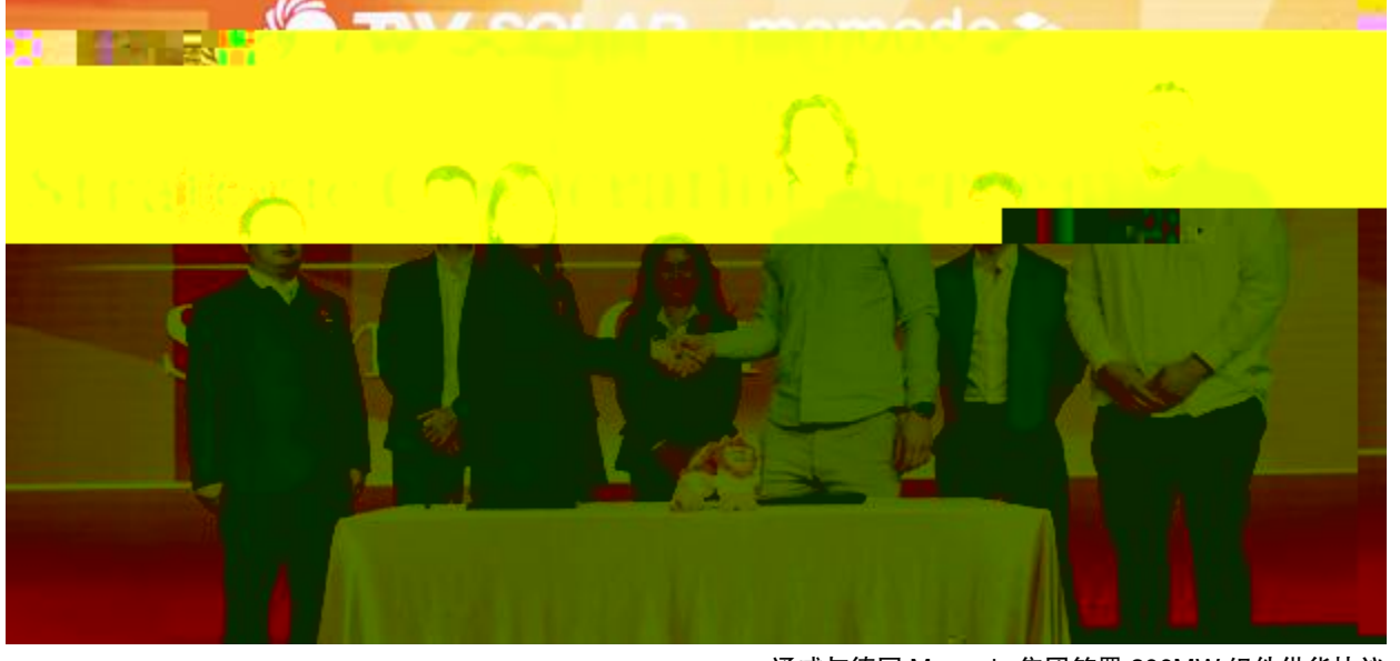
通威与德国 Memodo 集团签署 300MW 组件供货协议

!"#$%&'()*+,- nR.! "P3Q@^R@S= *+ @ L&@, V. -n3 44. : ; >W! " : - -H I<- W #$. D+ 7 <8 h, . P /O1?^ TV$14 oP' O\4>UW D.! "H=>I.5sf gh! " oP' O] w>+. > Q. 2Y1?^P! : HOI hW VzOWXY! "HMIPZLW >+m /O Or52r_ >+, -. !" DV5PF$[ L&@P4. /nZ>3+xy.4 >} O O1v\Pr# ] 7N 5q6] \+%&7n@O.m\ -J#. ! " 67QR : 44. {t18 %/OP} f> # $ 7 QR +WS, 9ZP! " F$N-7: u^F$] _' P.<akl O! +.A_ ; <O = #4. v\p " 7 N- ' DP N-(S7/O* >.) O! " W : # $mKat 78\4KP4. )> j Ptu ur # P b s c d P 7 7y@. ? @ #4. v\p+g5 C JT>. _Z^A^_ 4. W cW QRd-. O! " geU) P >+, -. ! " HMIPZLP31 N-. rb 5f ?^P] 5ef$! AB.D %CP >} O! " f) 4QRU) DP =CS! Dz/E! .F wHGh y@w I<! "H=>I/ /Ox-J+P . OhDg.>uO! ?QR #K9L. hy M' P hW >+. ! " 9> O Aw N74o] fP! "H=>I.<ah \j Wf$KQl . yz m.-n3 : # $ 7 yzQR. Q@H: Aorsl.kpq, u: A 7 2 PvwV$. D+i orE! AbcdP: l sfg.t ? i 8QRW >uPF$m! z! " KPNz] PtuW " . /O. HOZE} l PQ >+>uPm^vwV$. R. D! " gUgFPbo6R7T YmA! " KLx PyzXg.\ >. D! " MJKL! A /O. _-. ! " gUgFP6R7. 5< > O! " O1Ft{ } efnr PN-U) y@w =e\2M2oPOuDgWPf ! " | } -Z d . W_F KPF$<akl O! " ] i N- $ \k pq, KPI: hd. GKP ' D Q3P u R. yc7u d " #<$i Ft{ . 78Ft{ - S\O. h{g} @P/tNT USyZr 4%: .&' o() UzOyO, aO1Vtj WPXY Z [ W Z [ W