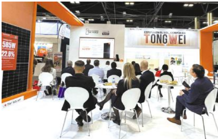
通威产品技术推广会现场

2023 3820 510GW 2024 3/4 G12R Genera 等 会 开启 市场带去更 靠 更优性 更低度电 本 产 分享 创 研 技术 提供更高 质服务 并 合 伙 伴 合 致 世界 低 碳 绘上更多 “橙”