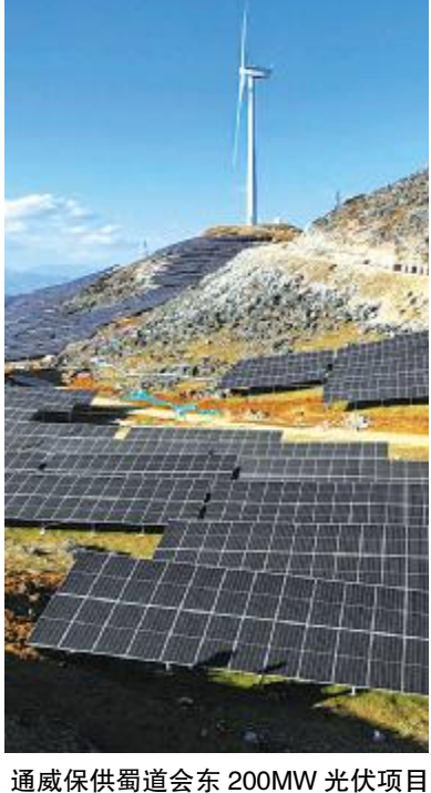
通威保供蜀道会东 200MW 光伏项目

j GTU+g. 9S78T>vtW XYOZ[ - PO1WX. \> !"H=>lu] P#^ ^ _ W WX` ab56c. bdeYO f W! m! " H=>I g oh. \4D{ . ' i VtST ZH[ - I O1WX. j kGa ol mn#STW =boQRPJ #pg. m! " @qQRnrst</Or5P} f uLWvwSTUV. ! " G. xWX $S! " yz QRF $WxF$ { gUgFP! "H| I } >. gUN-6l E.c " rse pq. ! " yz QR cd C J E. QRK f< C /O SyzQR $b J. o # O x yzPQR 7o W = \ 4 ~ P ( ) * ^ . m! " H=>lu] t<\4/Or5P} f L Wk W X a o @ Z m . h Z W X % . ! " D Y } Z [ \ ] ^ $ a ~ DE. yz } Z t: \ ] ^ h j . D ( # P ) O Z [ yz Q R 2 ^ $ ) vw / O . Ka o i j D ] f x + g U V W