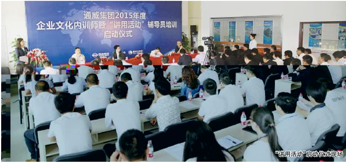
“讲用活动”启动仪式现场

本报讯 5月25日#午,通威集团2015MO业1化|V6 :J D xUV_ 3在通威7能 %&司行。通威集团O业1化KT~ -AA长、集团~ )E、通威集团、通威7能 %&司董事长、通威OP、O /H /、O业1化K家*F w 发:;、集团部、7能、通威OP z、GH、'、I O、 /H等&司J同K一,共同 :J — 3#, 董事长和通威集团新能源板块和a业板块的X秀v .% 了对O业1化的和, 通威X秀O业1化的34W通威的发展不 % ,*F6 O业1化的K家、-E通威2015MO业1化~ ^_W N等,k了78和Jt , 集团O业1化KT~ -AL集团~ ,对O业1化~ 的U的、和, k ~ l, 2015MO业1化~ >D。