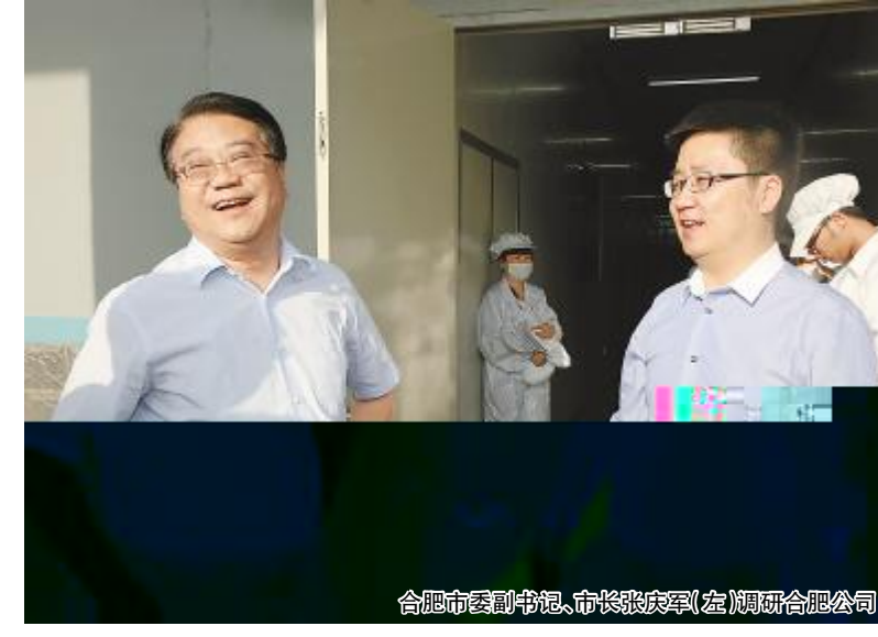
合肥市委副书记、市长张泉(左)调研通威公司

时事s ),SR Ja~时事sa : 等 体• ,t 对业 m O行 等h管。 董事长9管团YL 部 O~5人 全U 56), W 一@ 56_, 全 产人人> \、vv-5、向到 ,u向到v。在 全管 Cg#, &司]展 全产 o化6hO业 ~, 全 全管 体 8, 验 全管 _: w J, 据 全产 o化 ,cl xym m 2w,- 3UV1w, 全管 部O ^ 全产 o化 Z料o集、 对和 z~。 通威7能 %&司 x ~ 全 J,uMN Ae 产 mx ~ 全UV 26mw、新x-O 全 J 481人w, 部O' m 全xYr 源 { 和: <等KTUV 5w, 同时O行KT 全 J 123人w。 业人x [ 化、的 c、U体 ~Fj N、| )和E j N, 化 _ l k管 全业和全 J, & 司[Ae 产OK% ~、•、6 等 化_ 的业x和管 集中 化_ w UV。