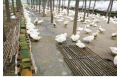
u 垄沟饮L(L脏,a漏网,较潮湿)