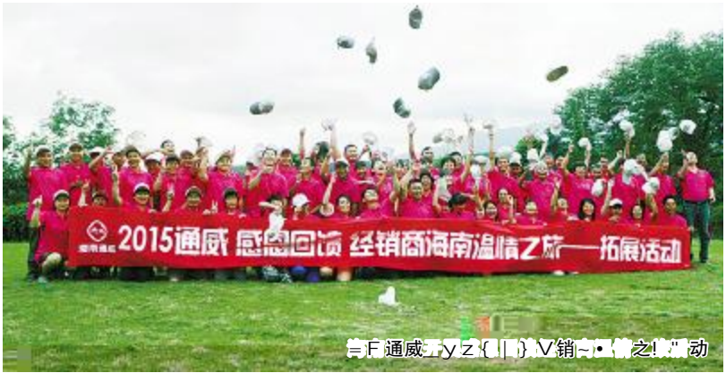
2015通威感恩回馈经销商海南温情之旅一拓展活动