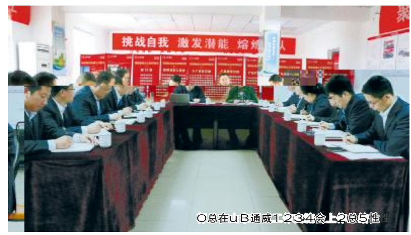
O总在uB通威1234会上2总5性