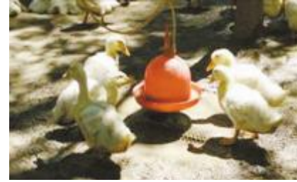
壶状饮L器(漏网面积dI,环境潮湿)

HI 鸭 _EL x养e 分8| I 3" 3?鸭@_E量9 格u{ | ?疫J序 分养殖L%做O<"48注" O< S) 7鸭n应j b"; k鸭n半&到1&